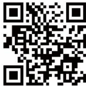
職涯發展中心 粉絲專頁